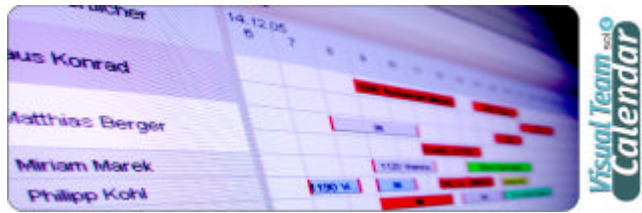
„Gantt Chart Ansicht“

ABSOLUT SENSATIONELL – VISUALISIEREN SIE IHRE RESSOURCEN MIT DEM EINZIGARTIGEN ‘VISUAL TEAM CALENDAR’