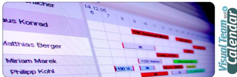
„Gantt Chart Ansicht“

ABSOLUT SENSATIONELL – VISUALISIEREN SIE IHRE RESSOURCEN MIT DEM EINZIGARTIGEN ‘VISUAL TEAM CALENDAR’