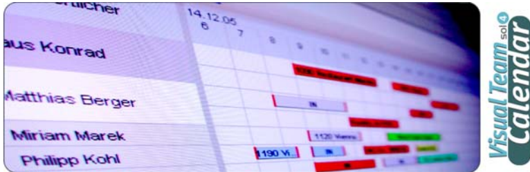
„Gantt Chart Ansicht“

ABSOLUT SENSATIONELL – VISUALISIEREN SIE IHRE RESSOURCEN MIT DEM EINZIGARTIGEN ‘VISUAL TEAM CALENDAR’